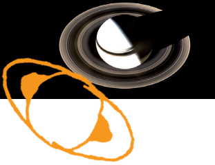
Exhibit in mostra

La mostra "Il Futuro di Galileo" propone, nell'ambito dello scenografico percorso espositivo, anche una serie di esperimenti più o meno interattivi che aiutano il visitatore a seguire gli sviluppi della scienza e ad impadronirsi di alcune fondamentali idee e risultati. Gli exhibit che qui vengono descritti sono stati realizzati in gran parte appositamente per l'evento.